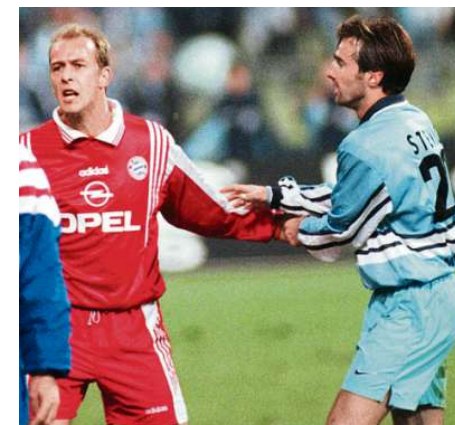
ZerreiBprobe. Auch bei Bayern gegen 1860 ging es stets hitzig zu.